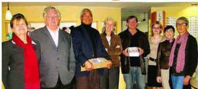
Une petite réception a marqué ce don, mardi soir, dans les locaux du magasin

Au-delà des dons (matériels scolaires, vêtements pour les enfants, médicaments), l'association a centré ses actions autour de quatre axes : la construction de fours de cuisson améliorés, l'amélioration de l'autosuffisance alimentaire, l'accès à l'eau potable ainsi que la création d'un complexe agricole.